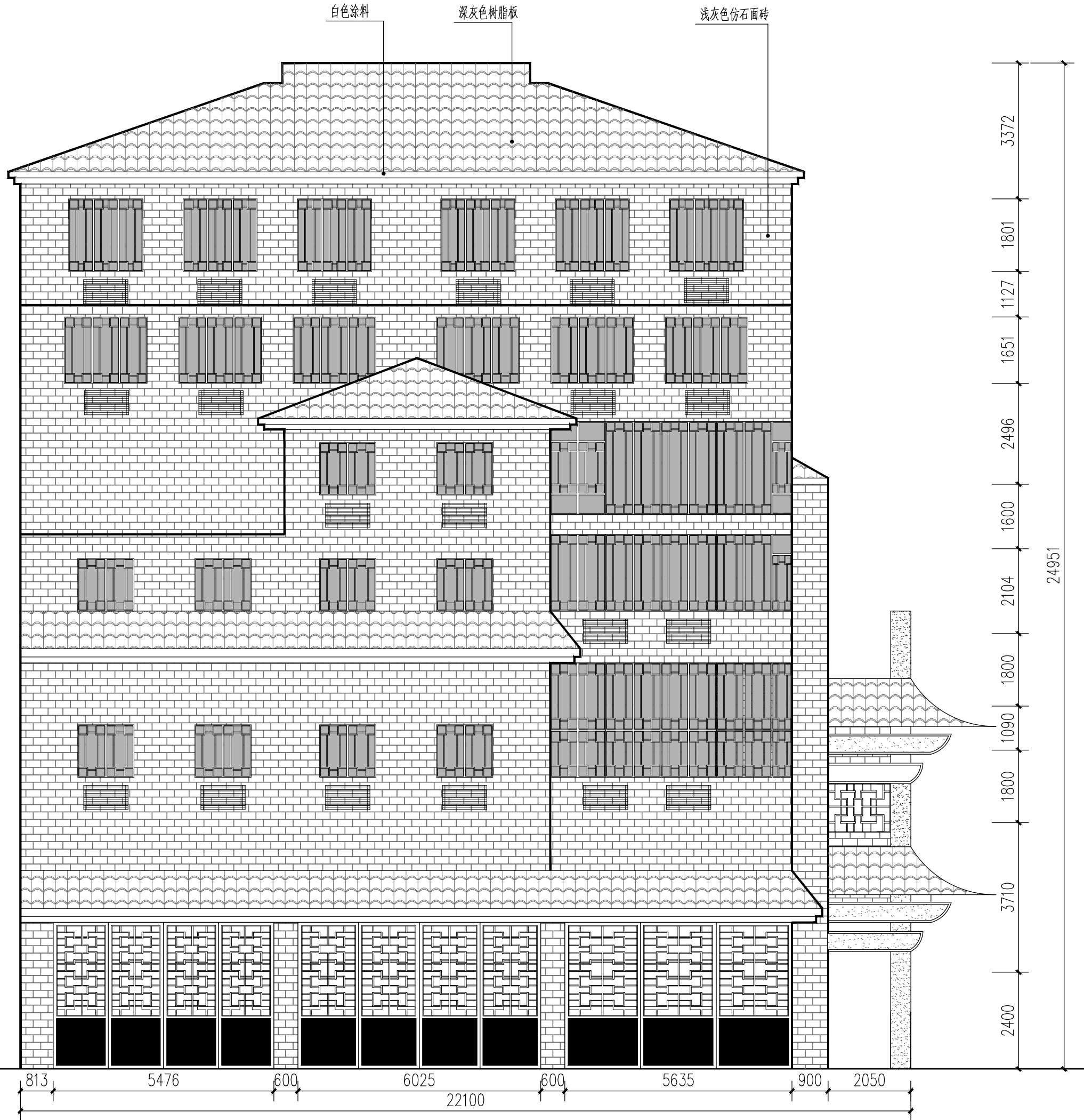
D-27井改造后东立面图 1:100